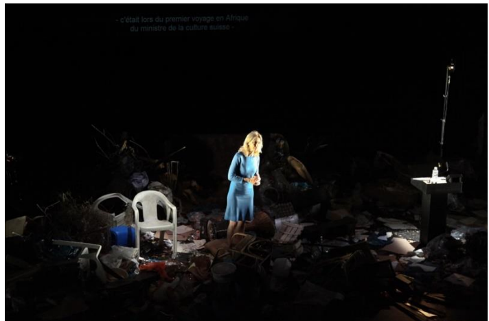
Szenenbild „Mitleid. Die Geschichte des Maschinengewehrs“

Milo Raus neue Produktion „Mitleid. Die Geschichte des Maschinengewehrs“ entsteht im Rahmen des europäischen Theaternetzwerks Prospero und wird zunächst als Voraufführung am 7. Dezember 2015 am Théâtre Nationale de Bretagne in Rennes gezeigt. Die Uraufführung in Berlin findet am 16. Januar 2016 statt.